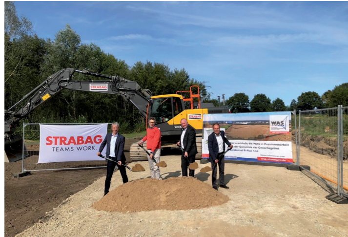
BILD: SPATENSTICH ZUR GEWERBEERWEITERUNG