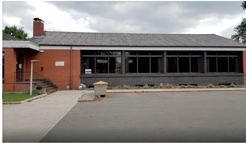
BILD: MEHRZWECKHALLE STELLAU

Für 930.000 Euro wird die Mehrzweckhalle in Stellau modernisiert, barrierefrei und erhält einen Anbau mit WCs, Lagerraum und